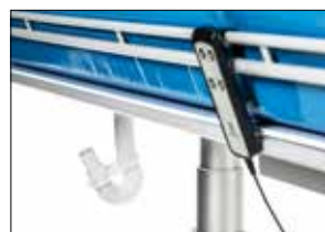
Handkontroll för höjd/tiltjustering