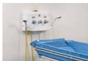
TR3200 med TR2810 Duschpanel