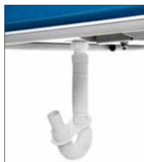
Flexibel avloppsslang med slanghållare