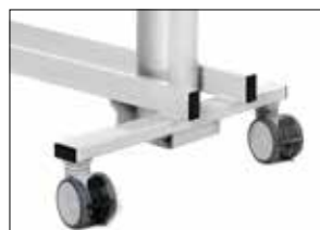
100 mm tvillinghjul som standard. 2 bromsade och 2 med rakstyrning alt. 4 bromsade hjul