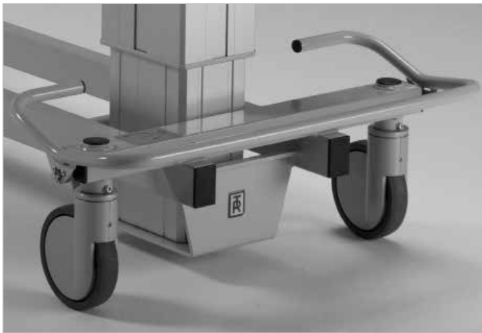
Bekvämt fotreglage för rakstyrning, transportläge och bromsning av hjul.

TR 4200 är tillverkad av varaktigt och tåligt material såsom pulverlackerat rostfritt eller elförzinkat stål som underlättar enkel rengöring och effektivt underhåll. Madrasen är löstagbar.