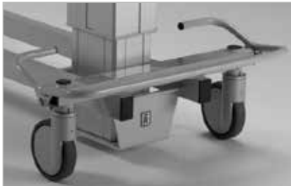
Bekvämt fotreglage för rakstyrning, transportläge och bromsning av hjul.

TR 4200 är tillverkad av varaktigt och tåligt material såsom pulverlackerat och elförzinkat stål som underlättar enkel rengöring och effektivt underhåll. Madrassen är löstagbar.